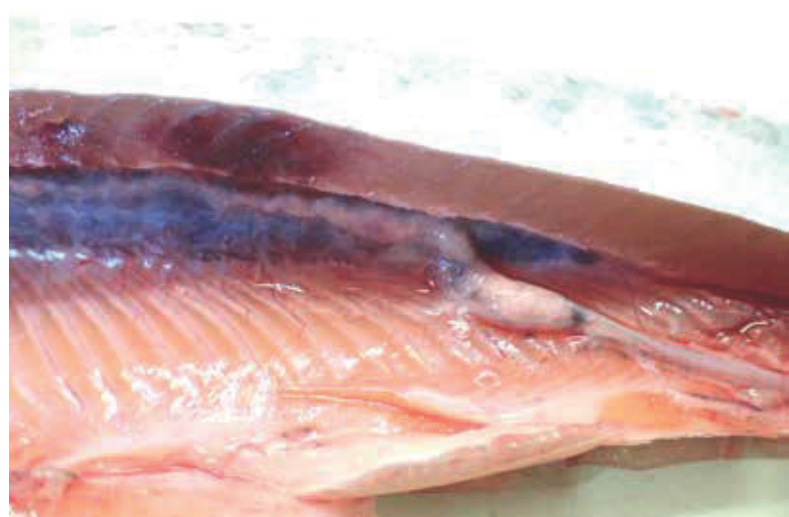
Figur 2. Døme på utfellingar i nyre og urinleiar.